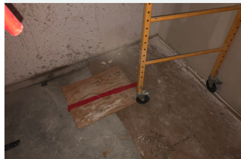
Фотография 2: Незакрепленный лист фанеры, закрывающий отверстие в полу.