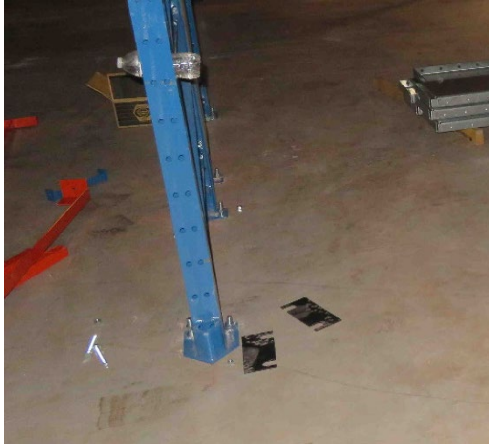
Fotografía 2. Cuñas niveladoras en el piso, cerca del soporte metálico donde los trabajadores estaban instalando bastidores.