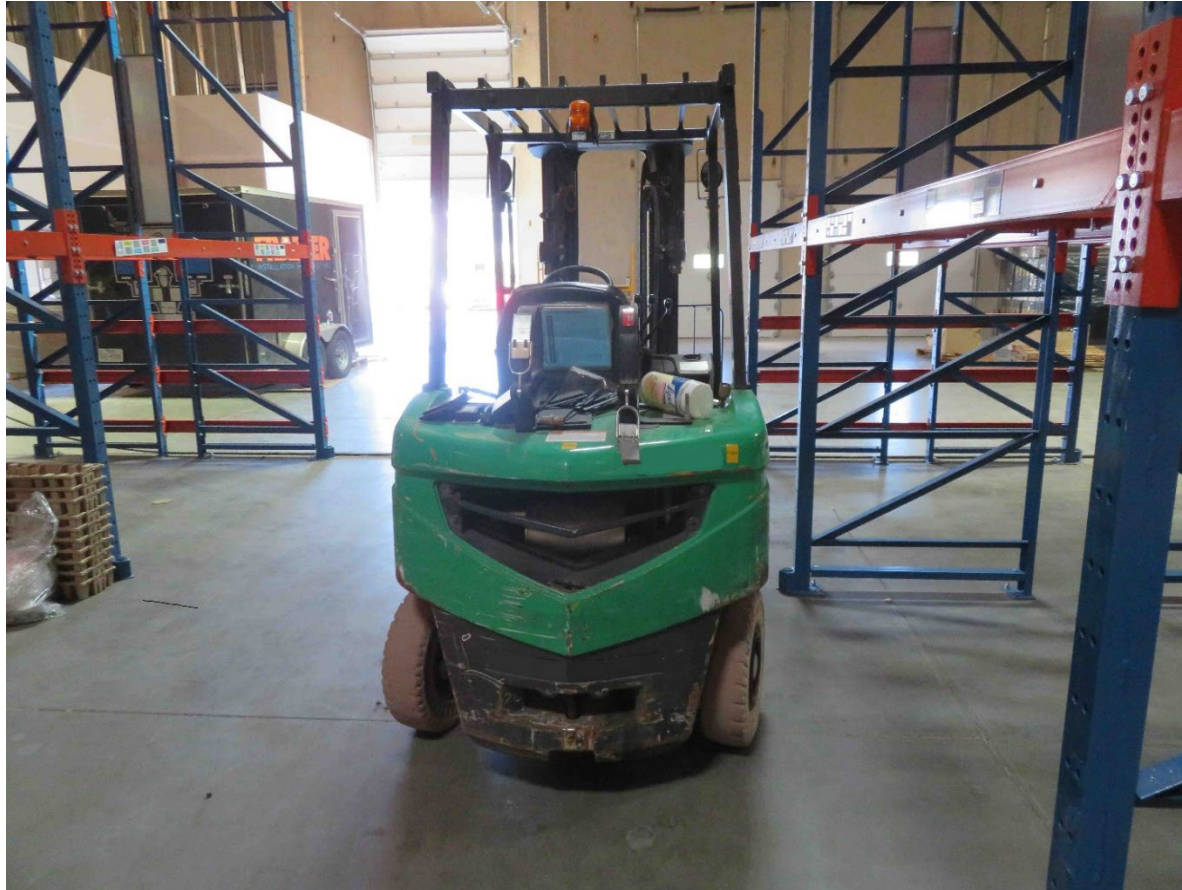
Fotografía 1. Parte trasera del montacargas que golpeó y aplastó al operador contra uno de los soportes metálicos.