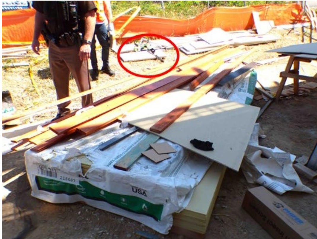
Fotografía 3. Lugar donde el instalador golpeó el suelo después de caer 23 pies. Su arnés de cuerpo completo estaba en el fondo (en el círculo).