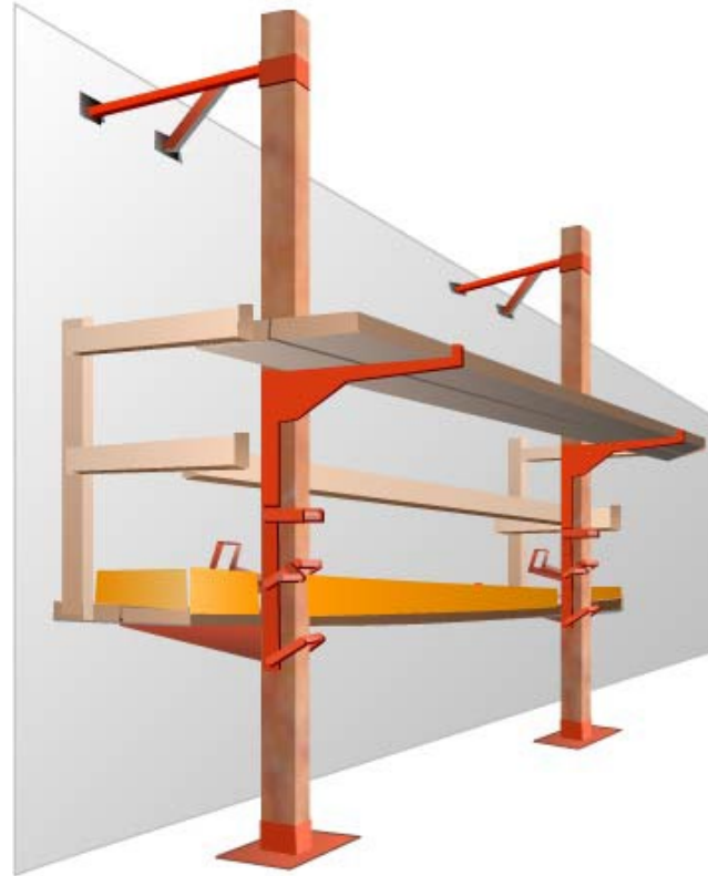
Ilustración 1. Andamio de palometa de gato con banco de trabajo y barandilla.