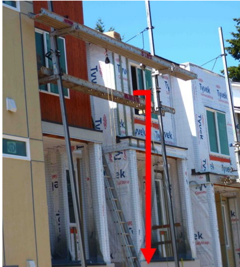
Fotografía 1. Andamio de palometa de gato sin barandillas desde el que el instalador cayó 23 pies.