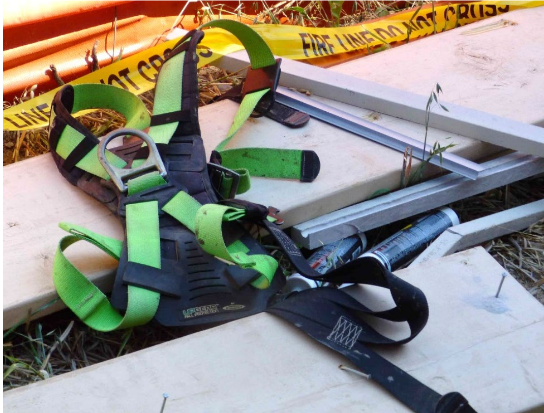
Fotografía 4. Arnés de cuerpo completo del instalador.