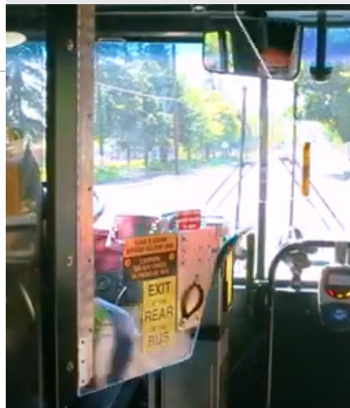
Автоматические защитные экраны, такие как показанный здесь, могут предотвратить травмирование плеча. Чтобы посмотреть, как работает этот тип защитных экранов, посмотрите это видео: www.youtube.com/watch?v=_O52f_g6Oag .