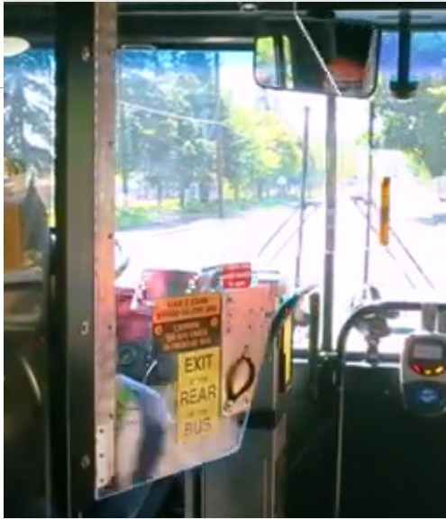
ከምዚ ዝኣመሰሉ ኣውቶማቲክ ናይ ድሕነት መከላኸሊታት ናይ መንኲብ ማህሰይቲ ክከላኸሉ ይኸእሉ። ከምዚ ዓይነት መከላኸሊ ከመይ ከምዝሰርሕ ንምርኣይ፡ ነዚ ቪዲዮ ረገጽ፡ www.youtube.com/watch?v=052fg60ag ። ናይ ኪንግ ካውንቲ ሜትሮ መመላለሲት ኣጋይሽ ተሽከርካሪት ዘርኢ ምስሊን ቪዲዮን።