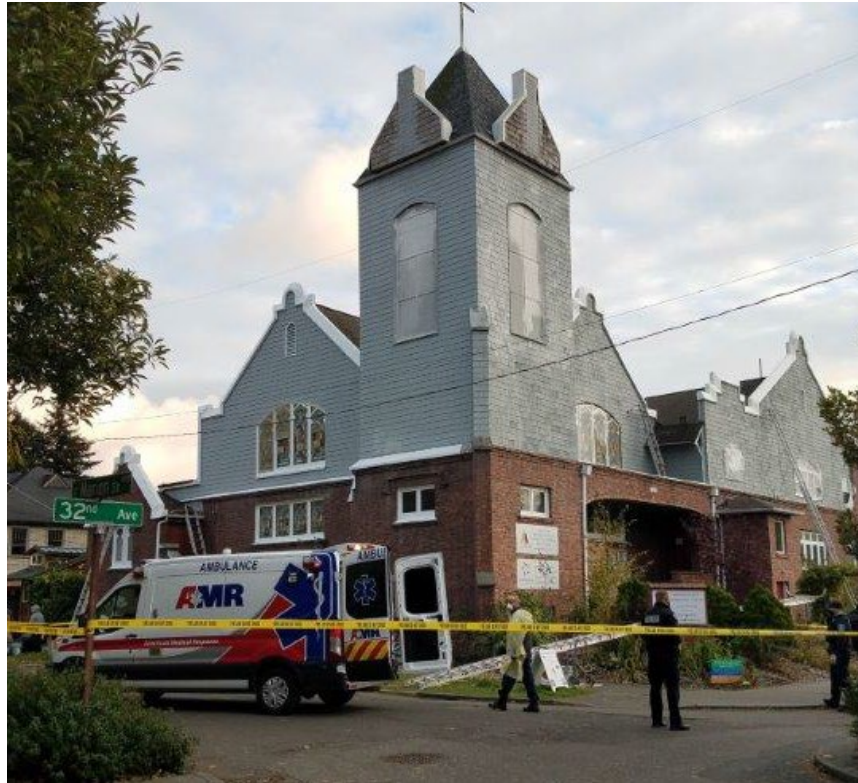
Fotografía 1. Escena del incidente, mostrando la iglesia que el contratista y su equipo estaban pintando.