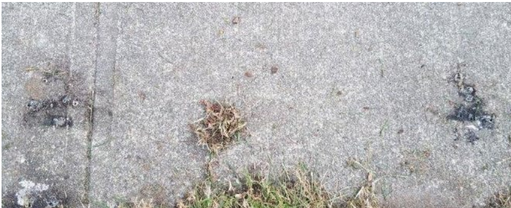
Fotografía 6. La acera con marcas de quemaduras en donde se había colocado la escalera de mano.