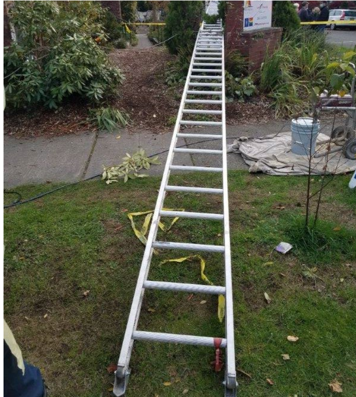
Fotografía 4. La escalera de extensión de aluminio de 48 pies de longitud que tocó el cable de electricidad elevado.