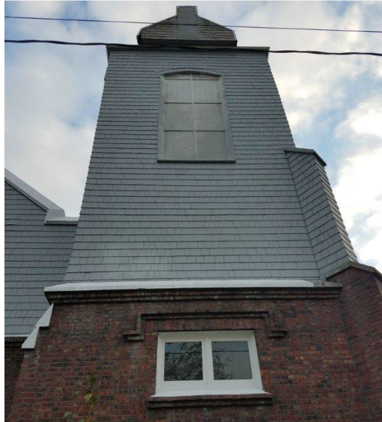
Fotografía 3. Vista del campanario de la iglesia y la proximidad al cable de electricidad elevado.